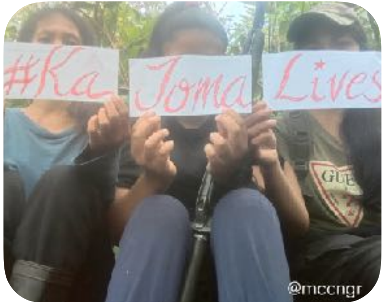
Ipinagbunyi ng mga Pulang mandirigma sa Negros ang buhay ni Ka Joma, Disyembre 19, 2022

Ang totoo, upisyal na inamin ng reaksyunaryong